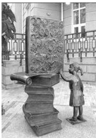
Таганрог. Перед городской библиотекой