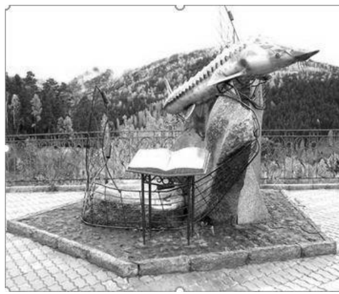
Красноярск. Памятник повести В.П. Астафьева «Царь-рыба».